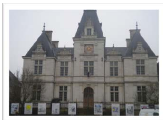
Espace Info Energie du Sud Mayenne, ancien palais de justice (à côté de l'hôtel de ville) Château-Gontier Tél. 02 43 70 14 18